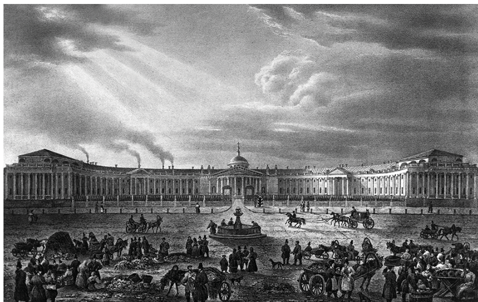
Странноприимный дом графа Николая Шереметева — репродукция гравюры из коллекции Музея истории и реконструкции Москвы.

10 июля (по старому стилю — 28 июня) отмечают 210 лет со дня основания одной из самых известных клиник в России: Института Склифосовского. Правда, тогда он назывался Странноприимным домом, или Шереметевской больницей.