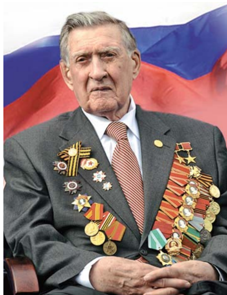
Уважаемые руководители окружных и районных советов ветеранов!

В эти майские дни я счел необходимым еще раз обратиться к вам по вопросу эпидемиологической обстановки, которая в стране крайне напряженная. Количество зараженных COVID-19 растет день ото дня.